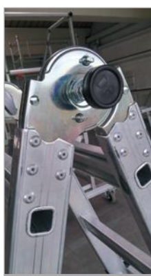
Bisagras robustas de acero y remachadas en 10 puntos por cada larguero