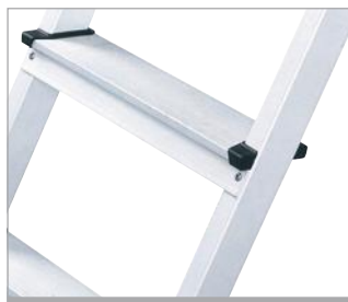
Peldaño remachado ¡6 veces! a los dos largueros

¿Estás harto de escaleras que bailan? Con cualquiera de estas tres alternativas se acabó el problema.