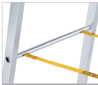
Cintas robustas y selladas en los extremos