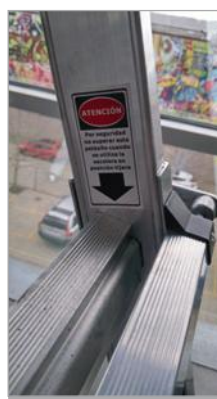
Peldaños estriados de 30x65 mm