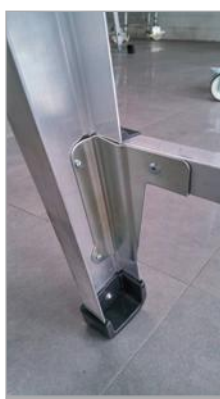
Escuadra de refuerzo en el primer peldaño