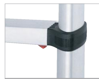
Mecanismo de ajuste