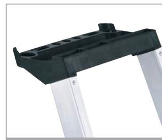
Bandeja para herramientas y material pequeño