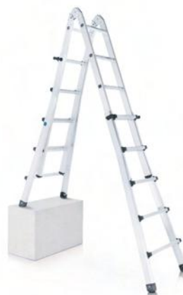
En tijera, a desnivel