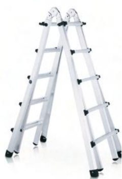
En tijera, cerrada

¿Quieres una escalera para toda la vida? Confía en el saber hacer del mayor fabricante de escaleras.