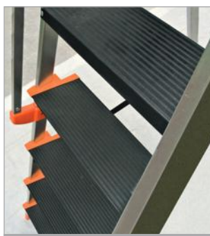
Detalle peldaños de 120 mm de ancho