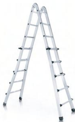
En tijera, extendida