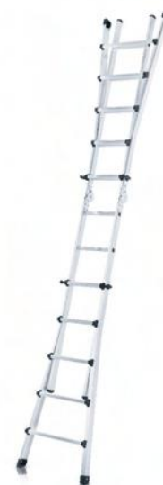
En escalera fija