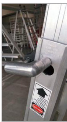
Bloqueo anti apertura en acero galvanizado de alta resistencia