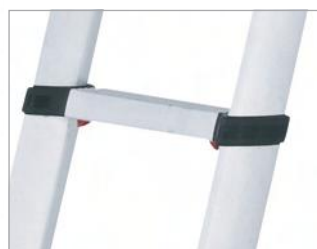
Peldaños de superficie ancha